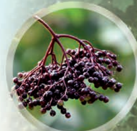
Baies du sureau