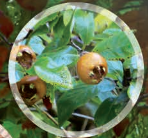
Nêfles ou «Mêles»