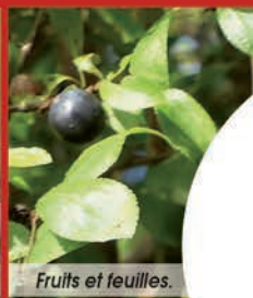
Fruits et feuilles.