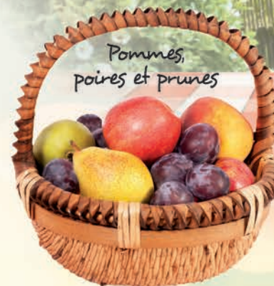
Pommes, poires et prunes