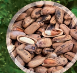
Pinons de Pin