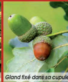
Gland fixé dans sa cupule.