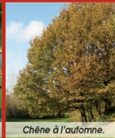
Chêne à l'automne.