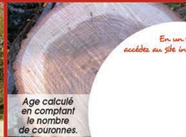
Age calculé en comptant le nombre de couronnes.