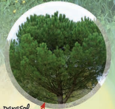
Le pin parasol