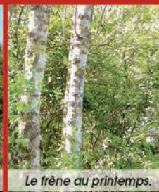
Le frêne au printemps.