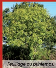
Feuillage au printemps.