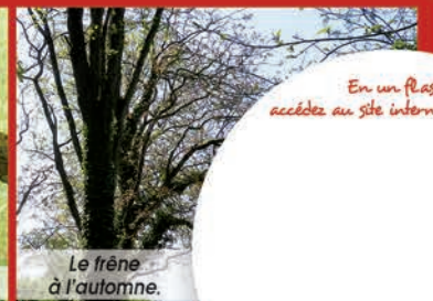
Le frêne à l'automne.